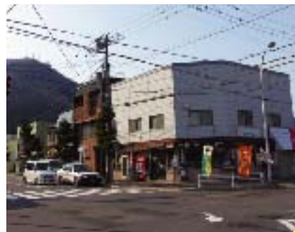
塗り替え前の町並み

今回の活動によって、谷地頭商店街の入口の両側2棟が塗り替えられ、函館山に向かって右側が計5棟塗り変わったことで(写真参照)、左側と同じく連続して5棟以上塗り変わるまでの将来像が見えてくる結果となった。外壁の基調色をアイボリー食に統一し、建物の一部を強調色として建物ごとに異なる色を使用する、という色彩計画の方針は、写真にあるとおり、背景の函館山の緑に映えて、明るく、まとまりのある町並みをつくると同時に、各建物が個性を表現し、リズムをつくる、というように目に見えるかたちで、その成果があらわれつつあると自負している。