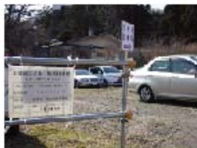
← 独自に国有地を借りた臨時駐車場

これを受けて、今年度は函館市教育委員会は公民館耐震診断調査、および公民館のあり方に関する市民懇話会を開催しました。イキ！ネットを含むさまざまな立場の利用者、専門家からの建設的な意見が重ねられ、現代の公共施設として当然備えるべき機能や性能を満たすような改修について、具体的な提言がなされ、教育長に提出されました。