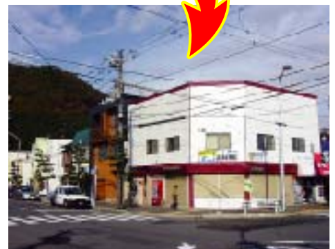
明るく、個性的になった塗り替え後の町並み