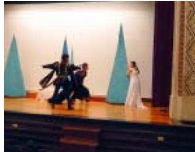
← 公民館マチネ第拾回 ～オペラde公民館～

イキ！ネットの目的は函館市公民館の改修ではありません。函館の歴史的建造物と、函館が今まではぐくんできた音楽文化による、函館ならではの文化振興とまちづくりが目的です。からトラからの助成は無くなりますが、今後ともからトラからの助成によって得た成果を目的につなげるように尽力したいと考えています。